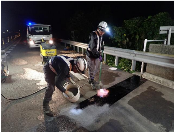
< 伸縮装置改良 >

伸縮装置の改良、トンネル付属物（非常用設備、照明設備など）、舗装（道路面）を常時良好な状態に保つための補修・点検などを実施しました。