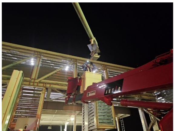
< ETC 設備点検 >