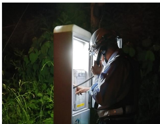
< 非常用電話設備点検 >