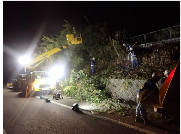
< 支障木伐採 >