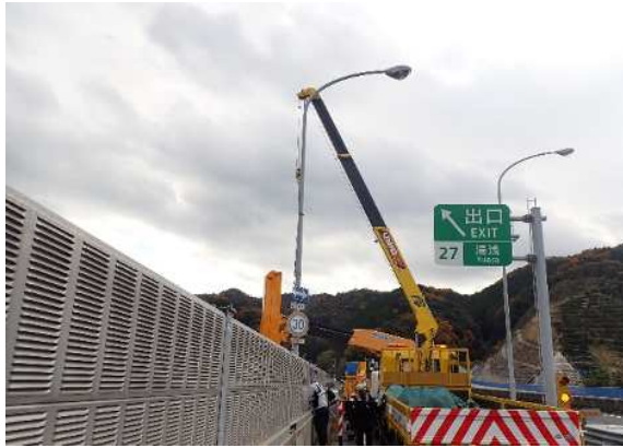
《道路照明設備点検状況》