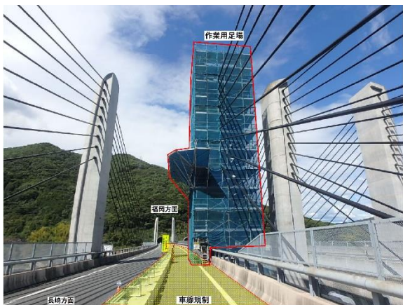
<作業用足場設置状況>