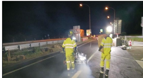
【路面標示施工状況】