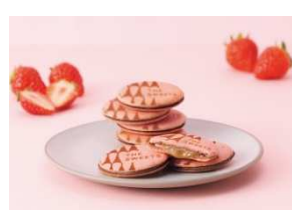
ストロベリーキャラメル サンドクッキー