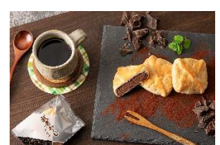
武者返し ショコラ